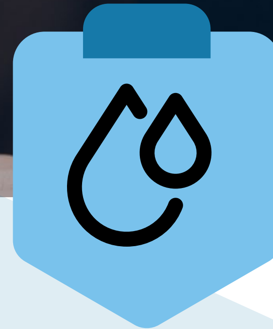
EAUX / INFRAS