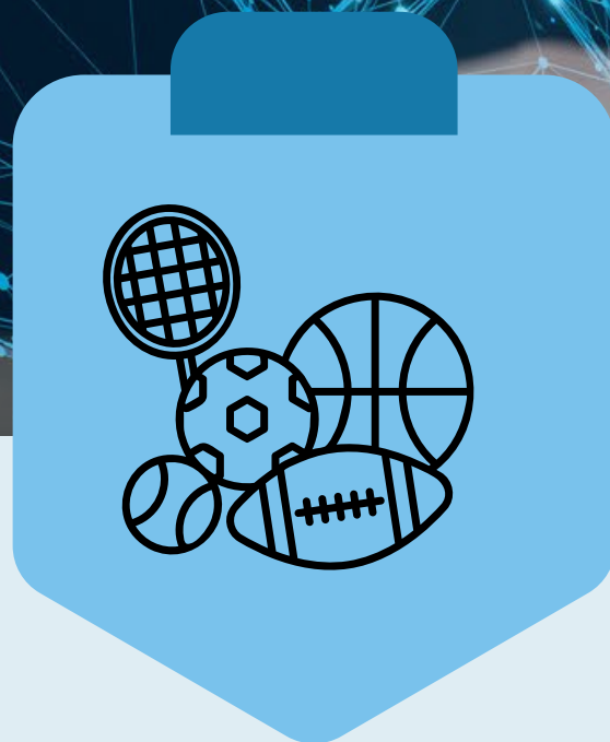
SPORTS ET LOISIRS