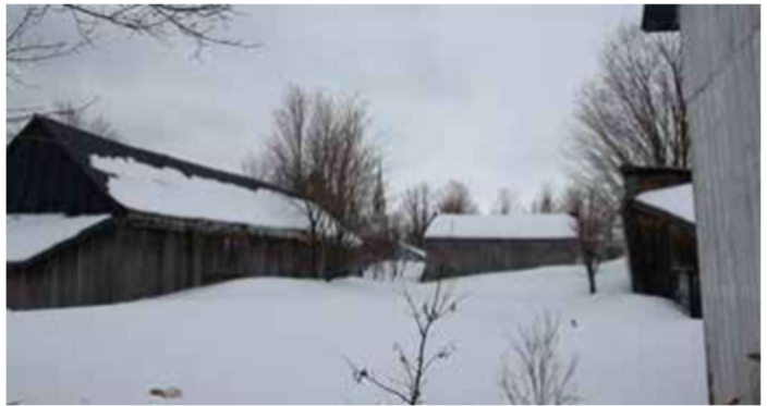
Figure 6 : Exemples de bâtiments complémentaires intégrés