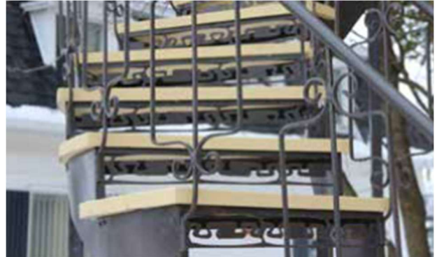
Figure 4 : Exemples de garde-corps à privilégier