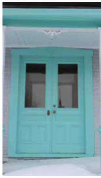
Figure 2 : Exemples de portes à privilégier