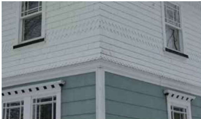
Figure 5 : Exemples d'ornementation à privilégier