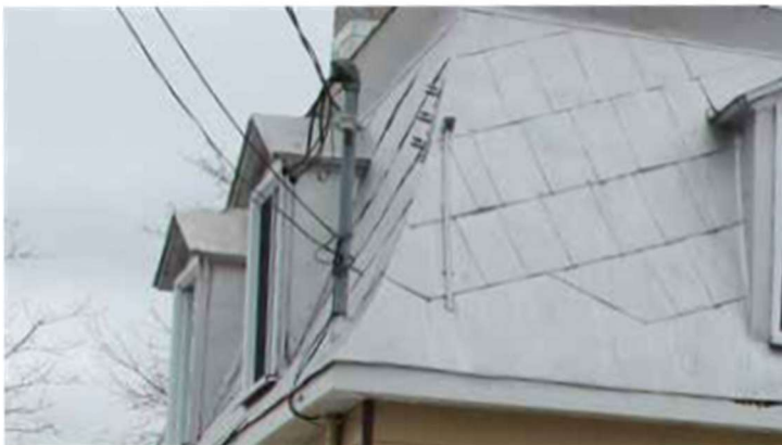
Figure 1 : Exemples d'assemblage, de forme et de couleur des matériaux de revêtements de toiture préconisés