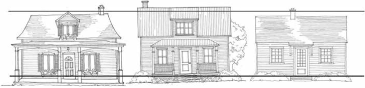
Figure 7 : Exemple d'intégration d'un bâtiment principal en fonction de la hauteur du bâtiment et de la fondation.