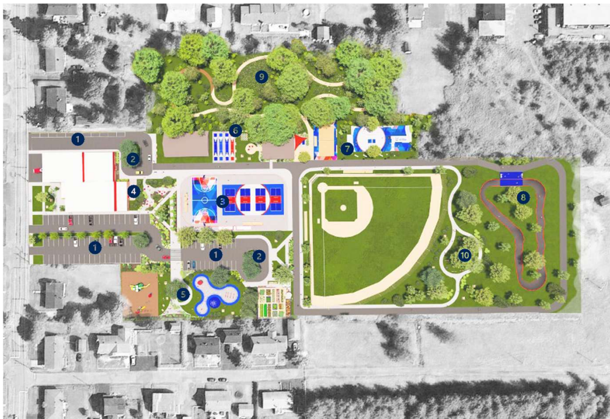
IMAGE 3D du projet produite par Tetra Tech