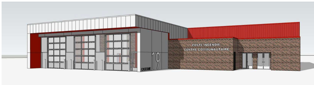
Projet du centre communautaire – 3D produite par Architecte

Face à ces constats, le projet vise à repenser intégralement l'aménagement du parc afin d'en faire un lieu multifonctionnel, sécuritaire et identitaire, capable d'accueillir un large éventail d'usages et de favoriser l'appropriation par tous.