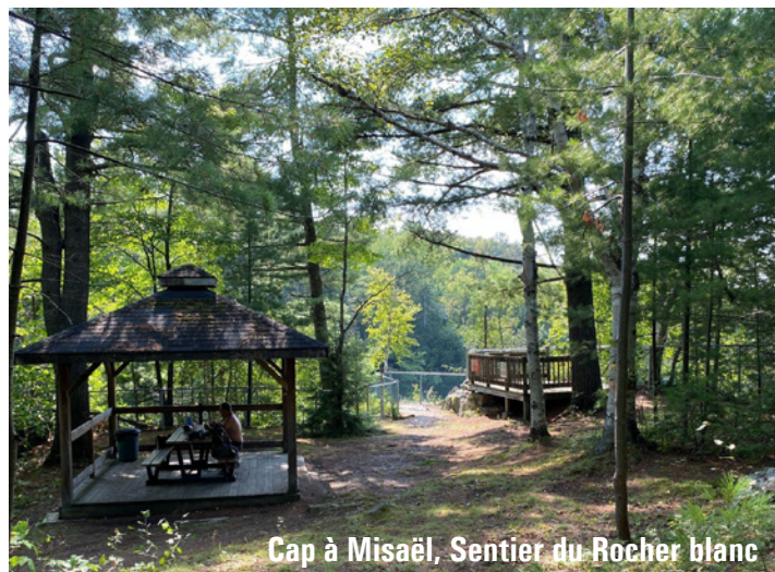
Cap à Misaël, Sentier du Rocher blanc